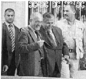
19日モスクワで開かれたイラク復興会議から戻ったイラク代表団のメンバーが記者会見で話している様子。