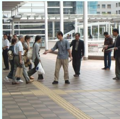
各地で行われた ビラ配布・街宣行動