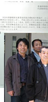
← 東二運掲示の前の 東一両木藤執行委員