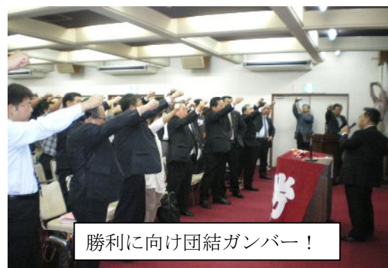
勝利に向け団結ガンバー！