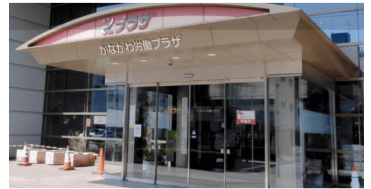
神奈川県労働委員会が入っている「かながわ労働プラザ」