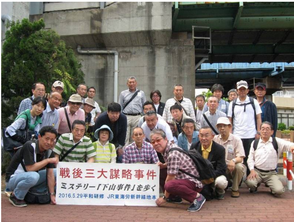
慰霊碑の前での集合写真