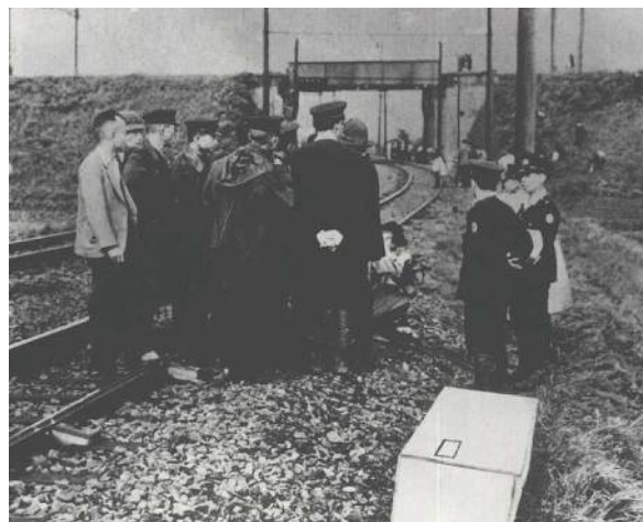
轢死体があった現場

参加者はこの「下山事件」の真相に目を向け、事件を風化させてはならないという思いを抱きました