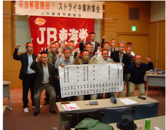
ストライキを闘い抜いた 組合員の皆さん