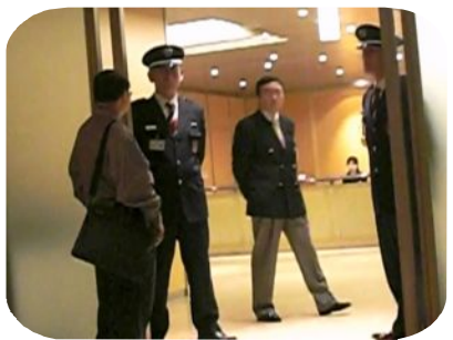
威圧する警備員と非現業社員！正面の白いのが謝罪掲示！