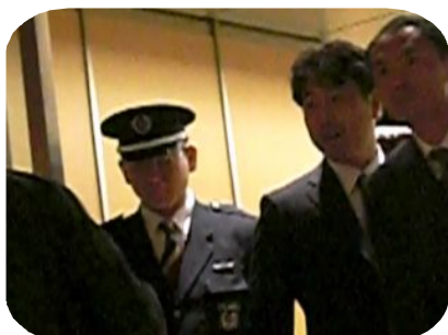
勤労課登場！！「遅いぞ！」