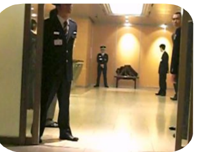
謝罪文の前には警備員！！