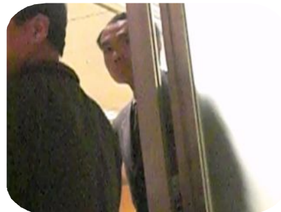
警備員の横から非現業！！