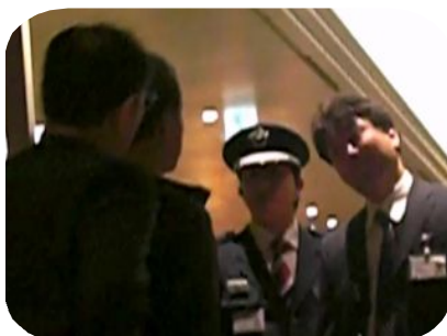
「組合として確認に来た！」