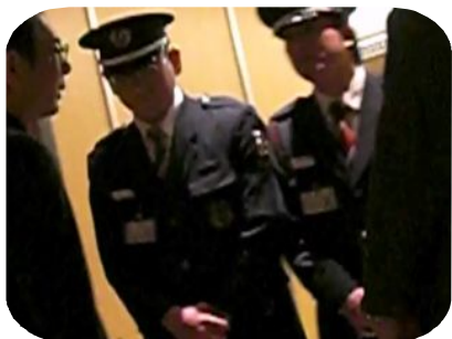
前面に警備員配置！