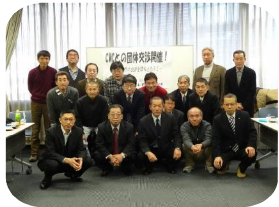
関西地本の仲間と共に