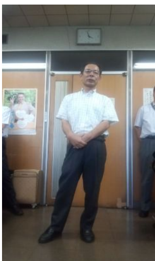
小屋敷代理人弁護士

都合の悪い尋問には「知らない」「記憶にない」を連発 ブザマな姿をさらけ出す！ 下平、永田 の両助役