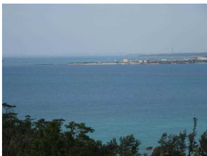
ジュゴンのいる辺野古