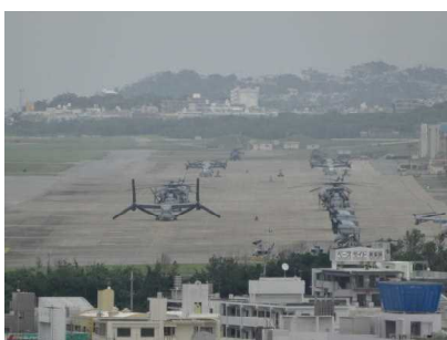
オスプレイが駐機する普天間飛行場