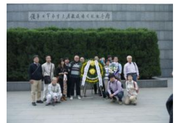
南京大虐殺記念館