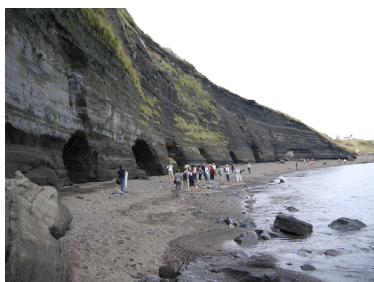
日本軍の魚雷艇を隠す穴