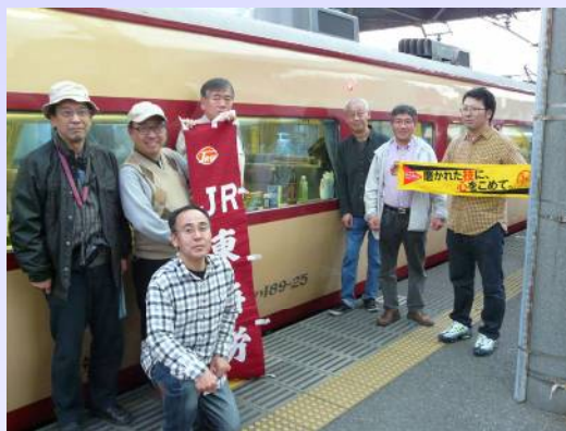
銚子電鉄車両図鑑

JR東海労一行は、銚子駅到着後仲ノ町駅まで移動し、構内に留置中の車両を撮影しました。その後、終点の外川駅まで乗車し、寿司屋で昼食を取りました。犬吠駅で土産を買い、銚子駅に戻りました。帰路の車内では、ご当地グルメをつまみに地酒を堪能しました。