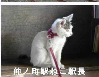
仲ノ町駅ねこ駅長